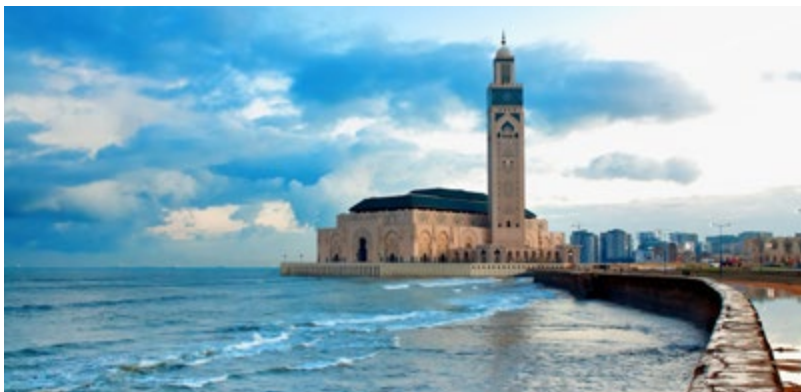
Hassan II Moschee in Casablanca, Marokko

*Business Class Upgrades verfügbar ab ausgewählten Flughäfen. Bei Nichtverfügbarkeit oder Nicht-Nutzung des Flugangebotes erhalten Sie eine Gutschrift.